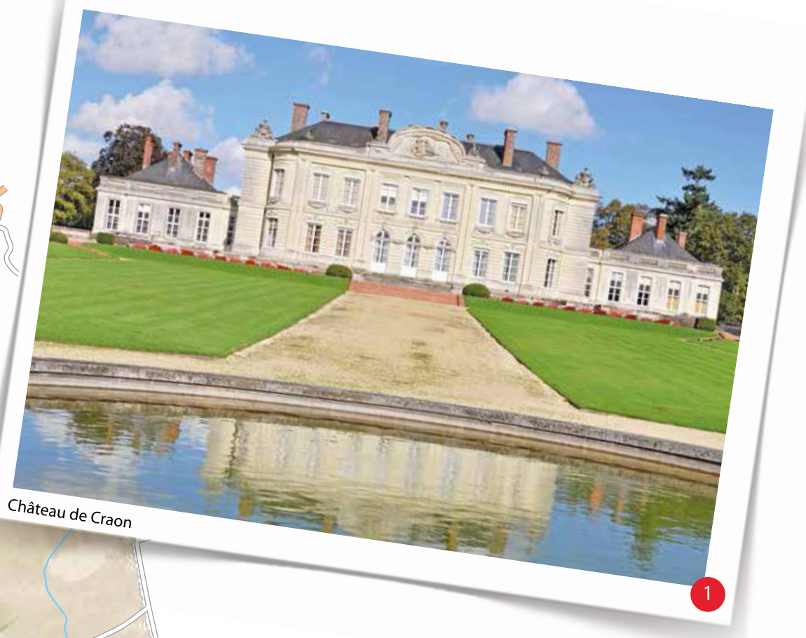
1 Château de Craon