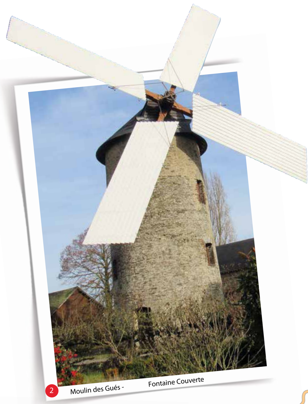
2 Moulin des Gués - Fontaine Couverte