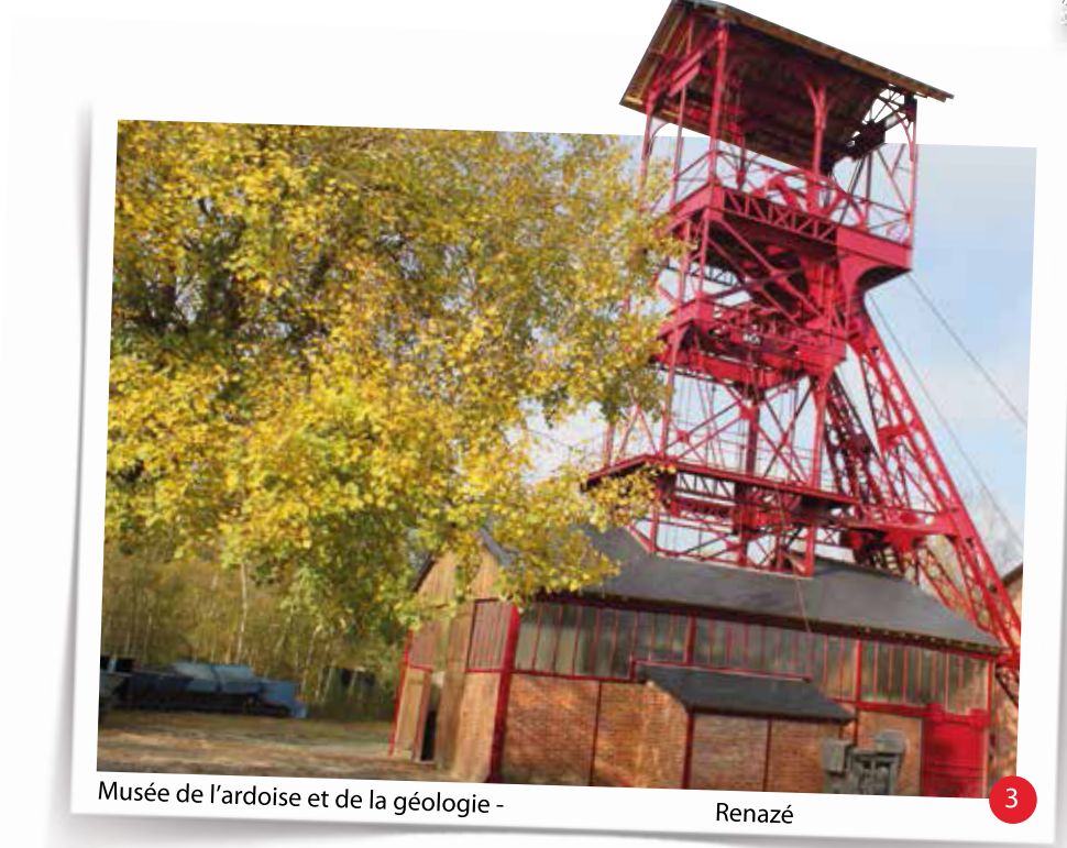
3 Musée de l'ardoise et de la géologie - Renazé