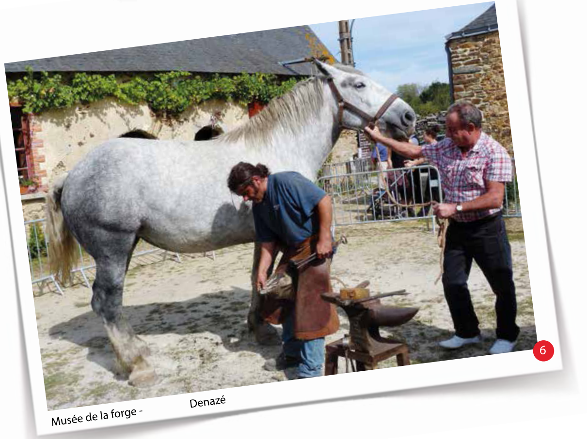
6 Musée de la forge - Denazé

Les circuits de randonnées sont téléchargeables sur le site www.paysdecraon.fr