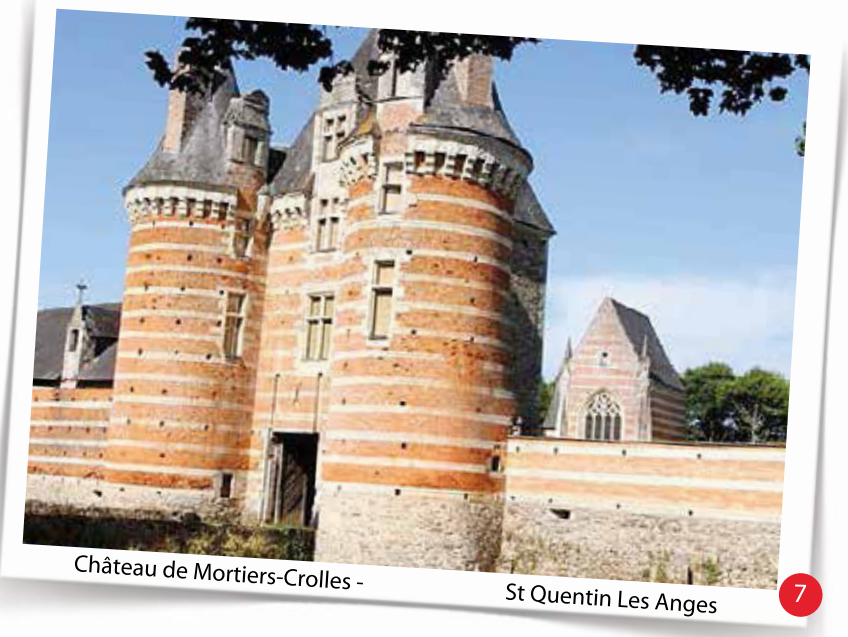
7 Château de Mortiers-Crolles - St Quentin Les Anges