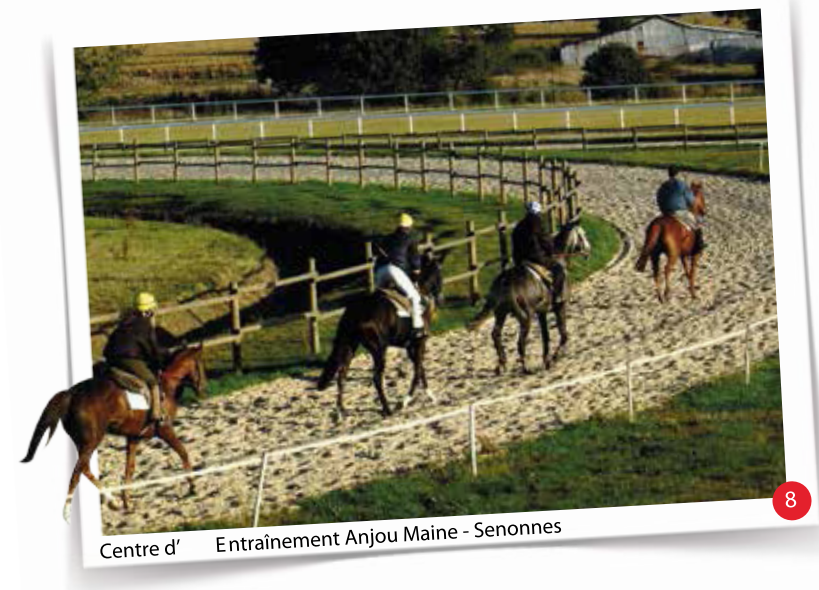
8 Centre d'Entraînement Anjou Maine - Senennes