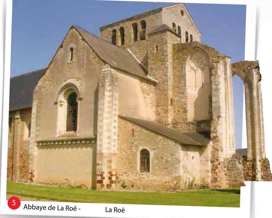
5 Abbaye de La Roë - La Roë