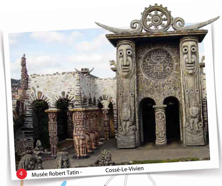
4 Musée Robert Tatin - Cossé-Le-Vivien